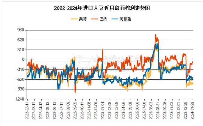
图 2：进口大豆现货压榨利润