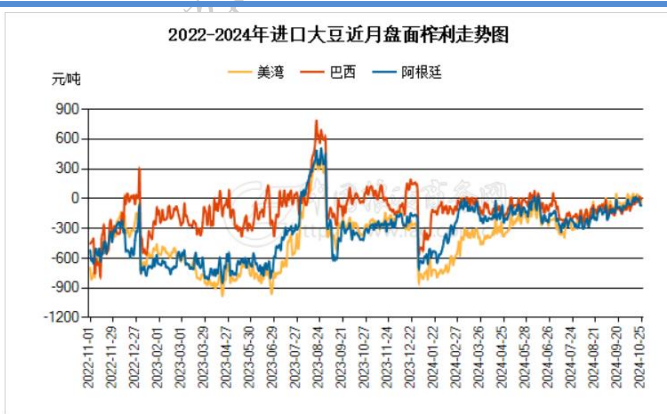
图 2：进口大豆现货压榨利润