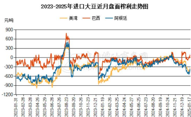
图 2：进口大豆现货压榨利润