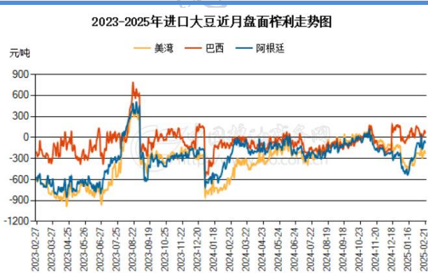
图 2：进口大豆现货压榨利润