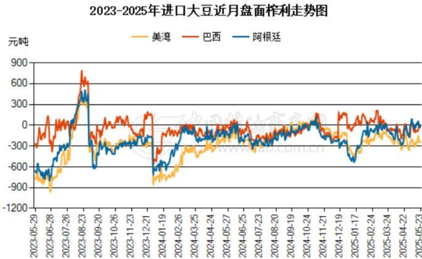
图 2：进口大豆现货压榨利润