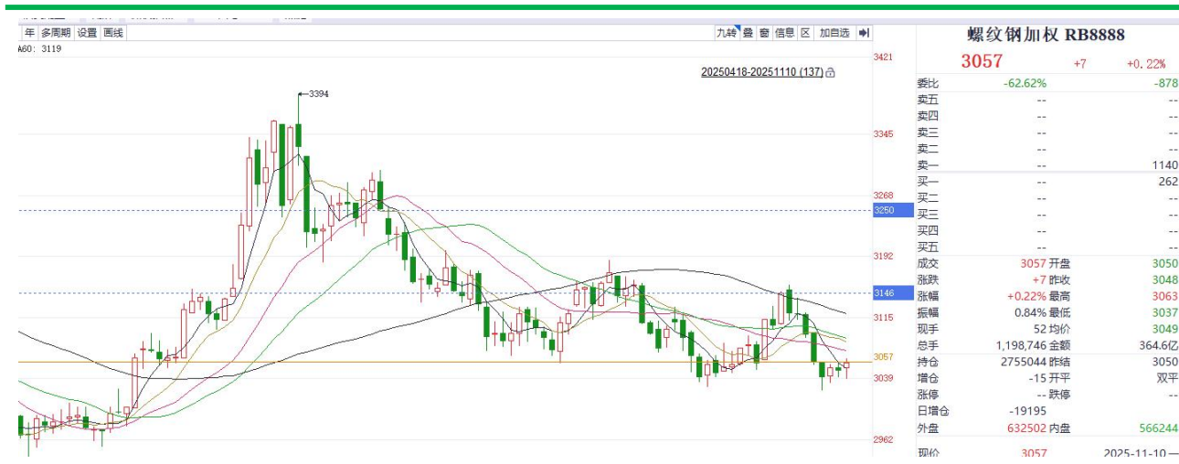
螺纹钢加权价格走势

钢材表观需求本周大幅走弱，contango 结构弱化，当前钢材估值中性偏低。从成本库存来看，钢材社会库存与钢厂库存走势同步去库，整体库存水平较低，原料价格延续高位震荡，钢材成本动态运行。短期关注现实数据改善，静待企稳后，区间操作为主。