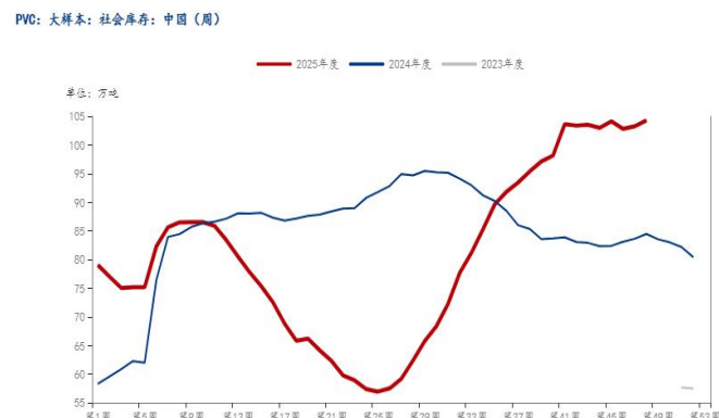
图 9：PVC 社会库存