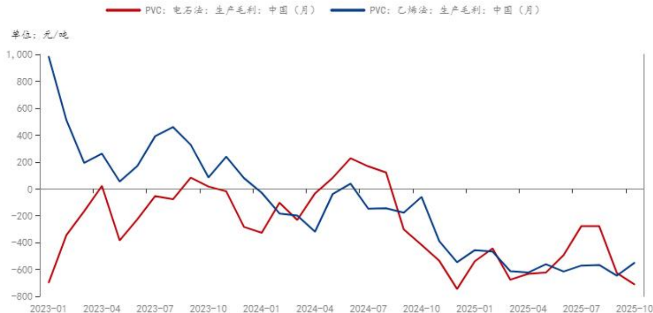
图 5：PVC 毛利