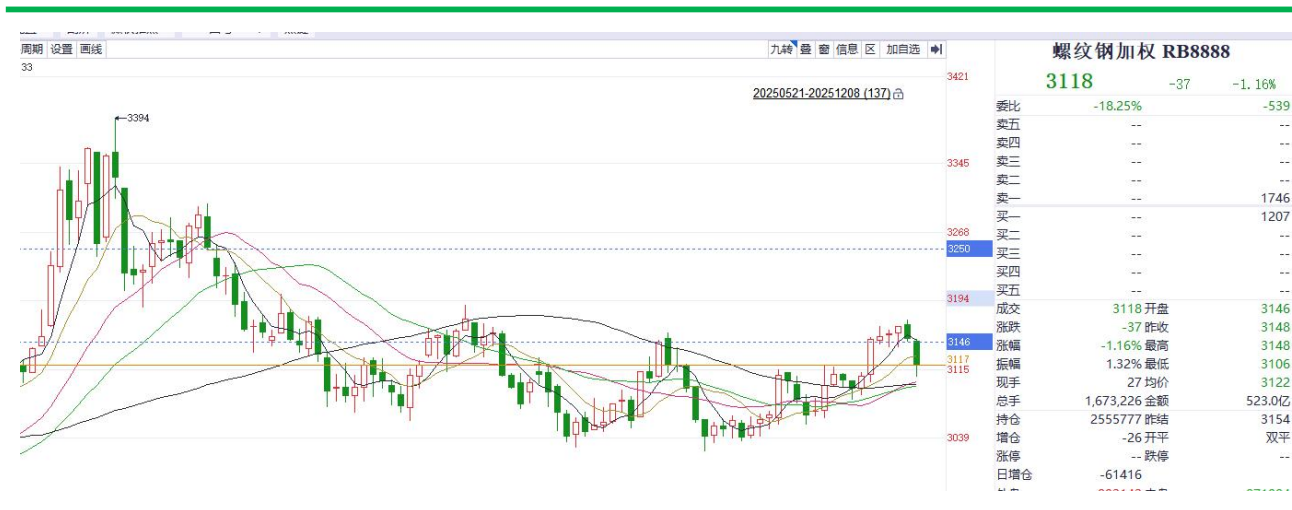
螺纹钢加权价格走势

钢材表观需求本周大幅走弱，contango 结构强化，当前钢材估值中性。从成本库存来看，原料端铁矿煤炭盘面价格短期大幅下挫，需警惕成本支撑松动风险，近期钢厂利润有所回升，钢材社会库存与钢厂库存走势同步去库，整体库存水平较低。短期关注现实数据改善，静待企稳后，区间操作为主。