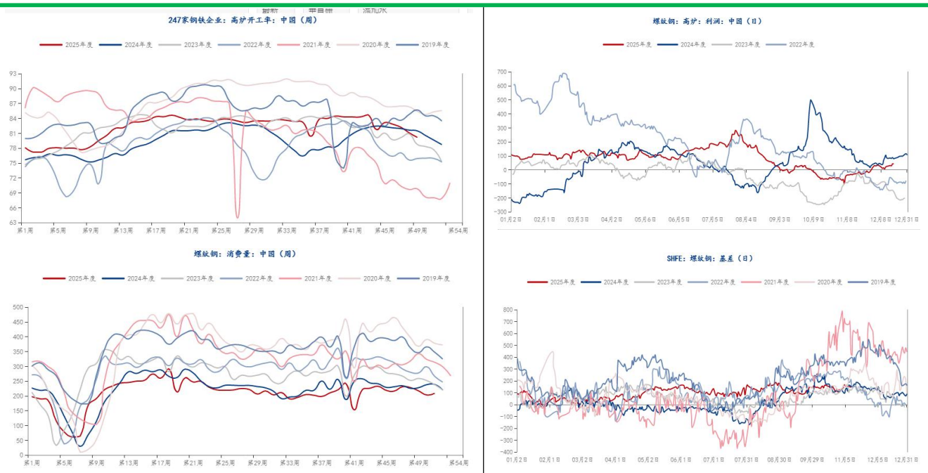
数据来源: Mysteel; 安粮期货投资咨询部

全国 247 家钢铁企业：高炉开工率本周收录 78.47%，环比上周下降 0.16%；钢厂高炉利润收录 42 元/吨，上涨 21 元/吨，处于今年同期合理位置；螺纹钢表观消费量：208.64 万吨，较上周上涨 5.5 万吨；螺纹钢基差 174 元/吨，环比小幅走弱。原料端铁矿煤炭盘面价格震荡企稳，成本支撑中枢重新构建，钢材总体估值中性偏低。