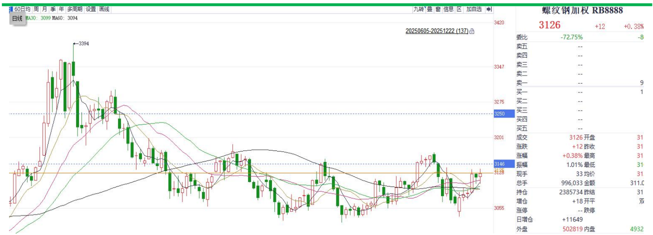
螺纹钢加权价格走势

钢材表观需求本周小幅回升，contango 结构弱化，当前钢材估值中性偏低。从成本库存来看，原料端铁矿煤炭盘面价格短期震荡企稳，成本支撑重新构建，近期钢厂利润有所回升，钢材社会库存与钢厂库存走势同步去库，整体库存水平较低。短期关注现实数据改善，静待企稳后，区间操作为主。