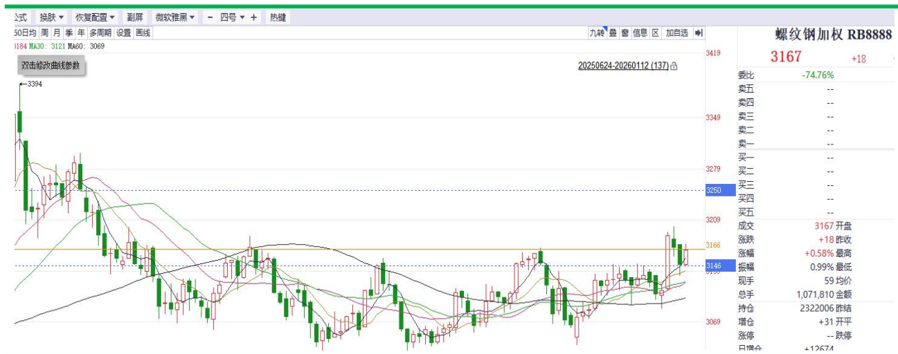
螺纹钢加权价格走势

钢材表观需求本周小幅回落，contango 结构弱化，当前钢材估值中性偏低。从成本库存来看，原料端铁矿煤炭盘面价格短期震荡企稳，成本支撑重新构建，近期钢厂利润有所回升，钢材社会库存与钢厂库存走势小幅累库，整体库存水平较低。短期关注现实数据改善，静待企稳后，区间操作为主。