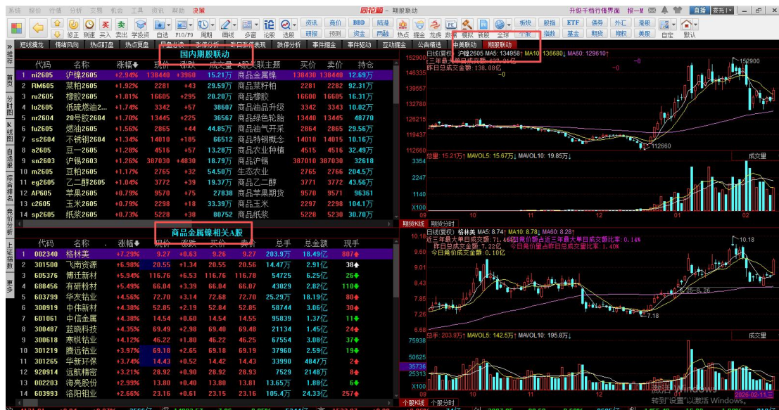
图：同花顺期股联动界面截图

以碳酸锂为例，碳酸锂产业链很长，从矿端到电池端，每个环节的受益逻辑和弹性都不同。单纯分析哪家公司“应该”涨，很容易陷入主观判断。此时，你应该借用数据工具来客观验证市场的选择。例如，同花顺的“期股联动”功能，能够基于实时行情，动态计算出哪些股票的走势与碳酸锂期货价格的关联度最高、资金流入最同步。这相当于让市场投票，直接告诉你当前的热点在哪里，帮你快速锁定目标池。