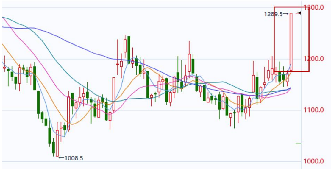
图：同花顺，安粮期货研究所