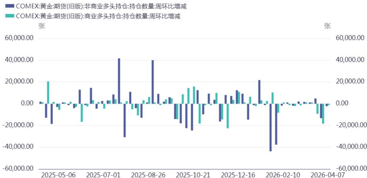
图九：黄金总持仓量

当前黄金期货总持仓量约 35.49 万手，净多头持仓占比仍处于历史中等偏高水平，表明市场对黄金中长期走势的整体信心尚未发生系统性逆转，但短期情绪确有降温。