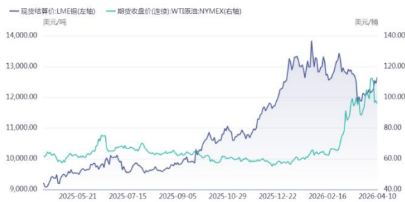
图四：WTI 原油、LME 铜