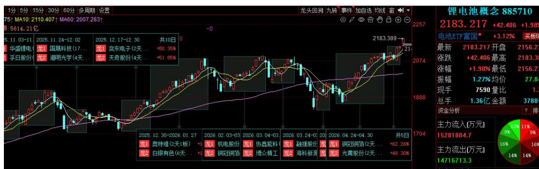
图：锂电池概念股指数